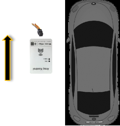
Resim 3 – Cihaz Yönü

Montaj sırasında herhangi bir olumsuz durumla karşılaşılması halinde 4440015 numaralı destek hattımızdan bize ulaşınız.