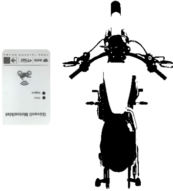
Resim 3 – Cihaz Montaj Yönü

Montaj sırasında herhangi bir olumsuz durumla karşılaşılması halinde 4449015 numaralı destek hattımızdan bize ulaşınız.