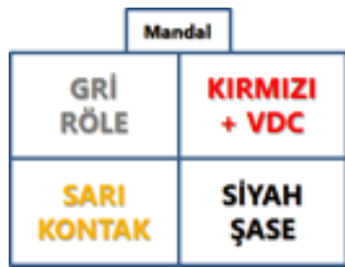
Resim 1 – Konektör Pin Dizilimi